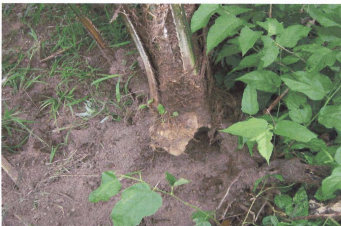
Figura 10. Destrucción del bulbo por la tuza