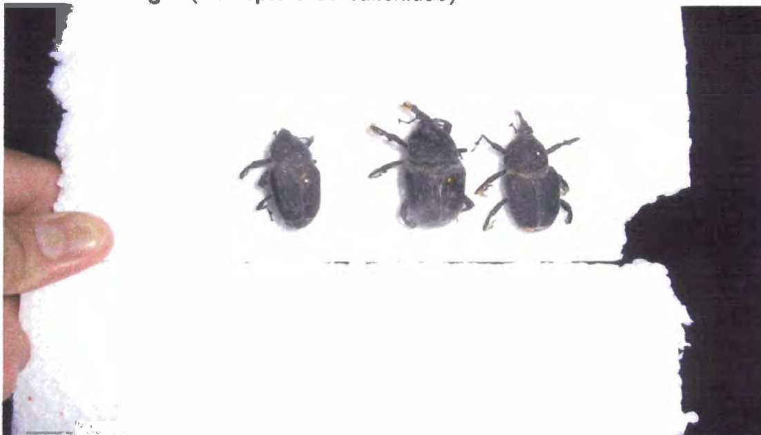
Figura 1. Picudo negro. Rhynchophorus palmarum