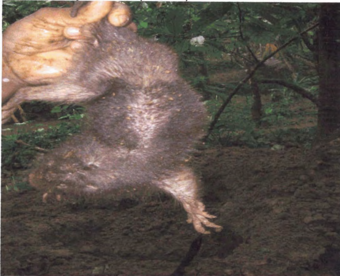
Figura 9. Captura de la tuza